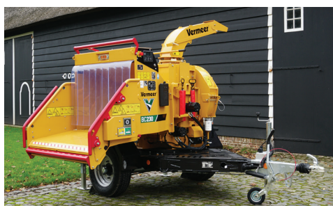
TABLE D'ALIMENTATION ROTATIVE

PRATIQUE. Elle permet de faire pivoter la table alimentation du broyeur sur 7 positions afin de faire face au matériau pour faciliter l'alimentation et le travail en bord de route. Un frein à inertie réglable en hauteur est disponible en option pour le BC230.